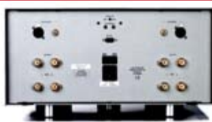
Primare A32 – bak